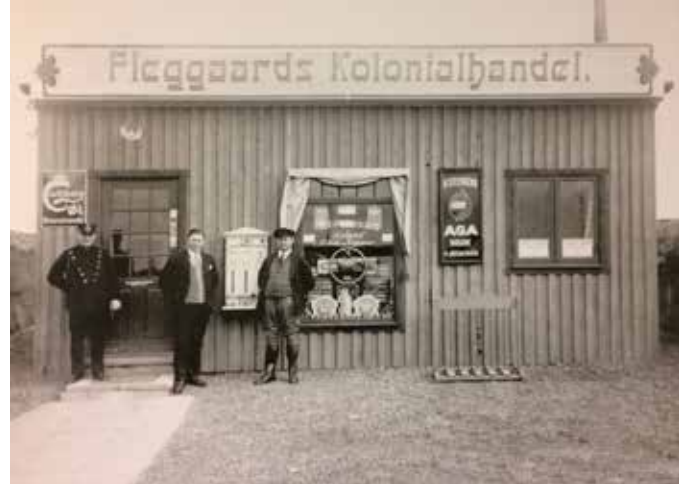
Fleggaard Holding A/S.

■ There are many traces of colonial history in the Sønderjylland-Schleswig region. In recent years, researchers from various disciplines have been looking for colonial connections in the German-Danish borderland. As a result of their work, a richly illustrated anthology now presents a panoramic collection of this research. In more than 20 papers, the contributors look at the architecture, tell the story of our consumption, present ways of life or take a critical look at our memory culture. They bring long forgotten events to life, or set wellknown phenomena in a new framework. In this way, it becomes clear how the colonial system shaped our world and how it still plays an important role in our everyday life..